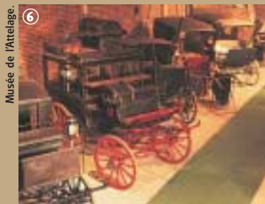
Musée de l'Attelage. ⑥