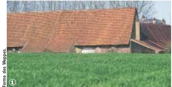
Ferme des Weppes. ①

Randonnée Pédestre Autour de la Libaude : 11 km