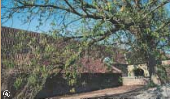
Ferme des Weppes. ④